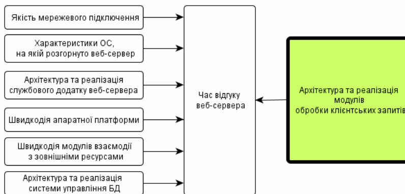
Рисунок 1– Фактори, які впливають на час відгуку веб-сервера

В даній роботі ми не будемо зосереджувати увагу на апаратних і мережевих факторах, а також факторах, пов'язаних із операційною системою, службовим додатком чи системою управління базою даних. Зосередимось на модулі обробки клієнтських запитів.