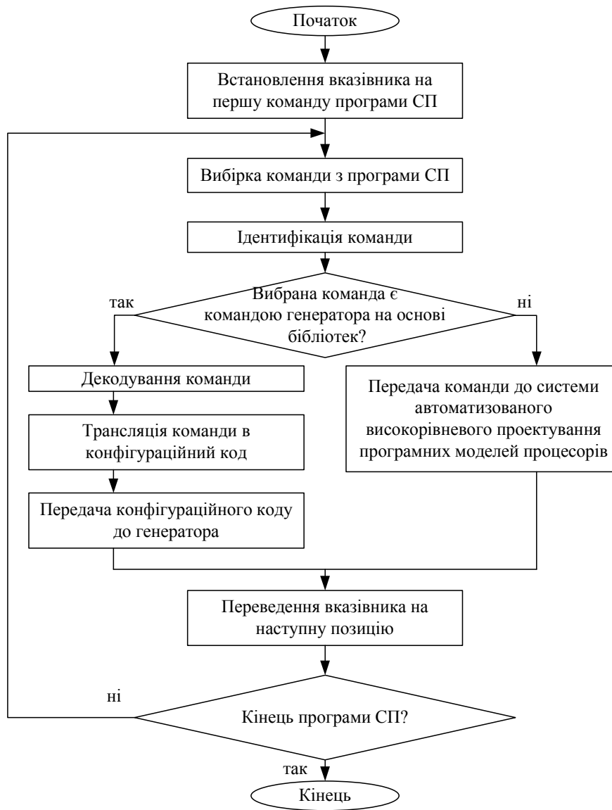
Рисунок 2 – Блок-схема алгоритму роботи блоку аналізу коду

Запропонована система автоматичного генерування функціонує під керуванням блоку аналізу коду. Цей блок визначає, котра з компонент системи генерування буде генерувати програмну модель. Алгоритм функціонування блоку аналізу коду можна описати у вигляді блок-схеми, представленої на рис. 2.