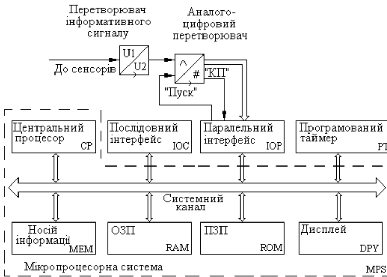
Рисунок 2 – Структура пристрою для реєстрації ЕКГ

де n – кількість необхідних реєстрованих періодів ЕКГ; T_{EKG} – тривалість періоду ЕКГ.