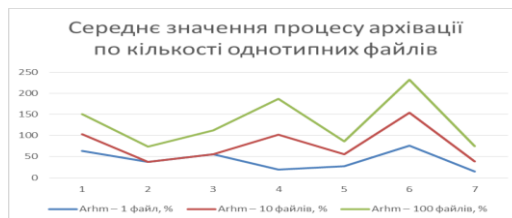
Рисунок 3 – Діаграма процесу архівації

Запропонований метод архівації однотипних файлів дає приріст середнього значення процесу архівації на 10,85%. А зі збільшенням кількості однотипних файлів для процесу архівації цей показник може все більше зростати.