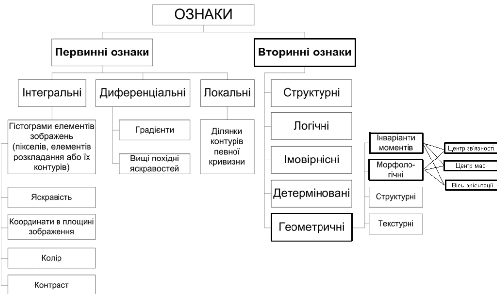
Рисунок 3 – Загальна класифікація ознак об’єктів

Авторами вдосконалено відому класифікацію ознак [1], у якій визначено нові типи вторинних геометричних ознак (рис. 3.) Розглянемо детальніше кожен з типів ознак.