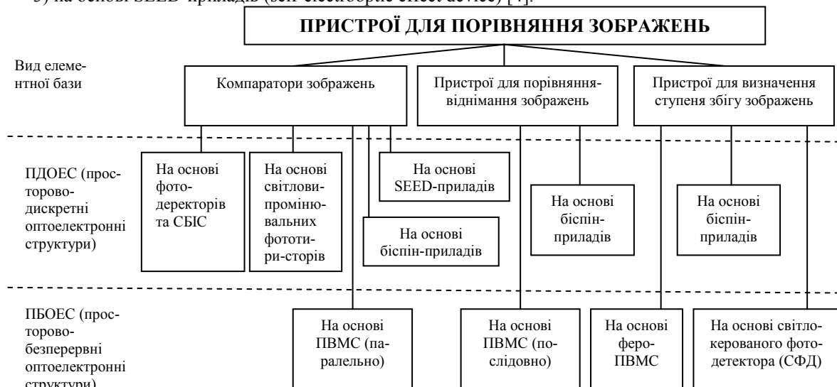
Рисунок 2 – Паралельні оптоелектронні пристрої для порівняння зображень